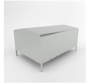
Kapell med ram